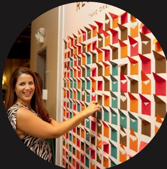
Стенд с пожеланиями