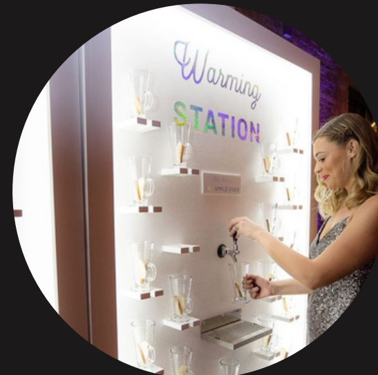
Станция горячих напитков