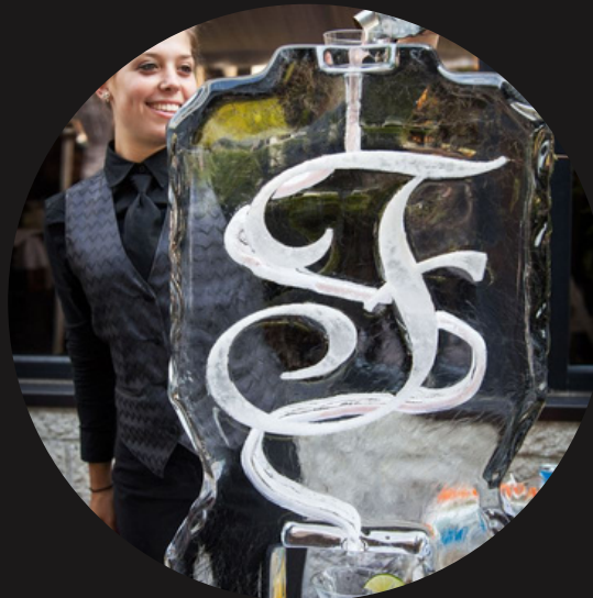
Монограмма логотипа компании из льда