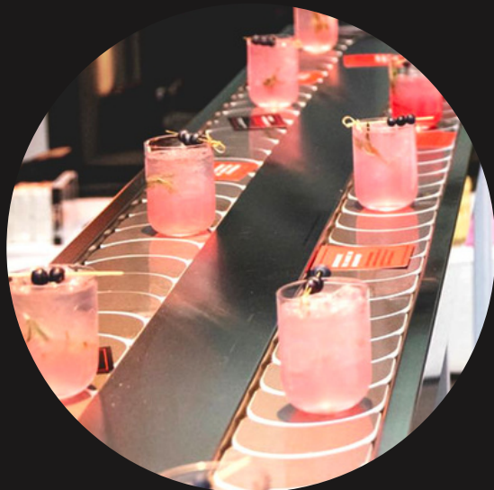
Оригинальная барная карта с названиями и цветами бренда