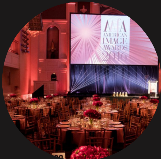
LED экраны отображают стилистику компании